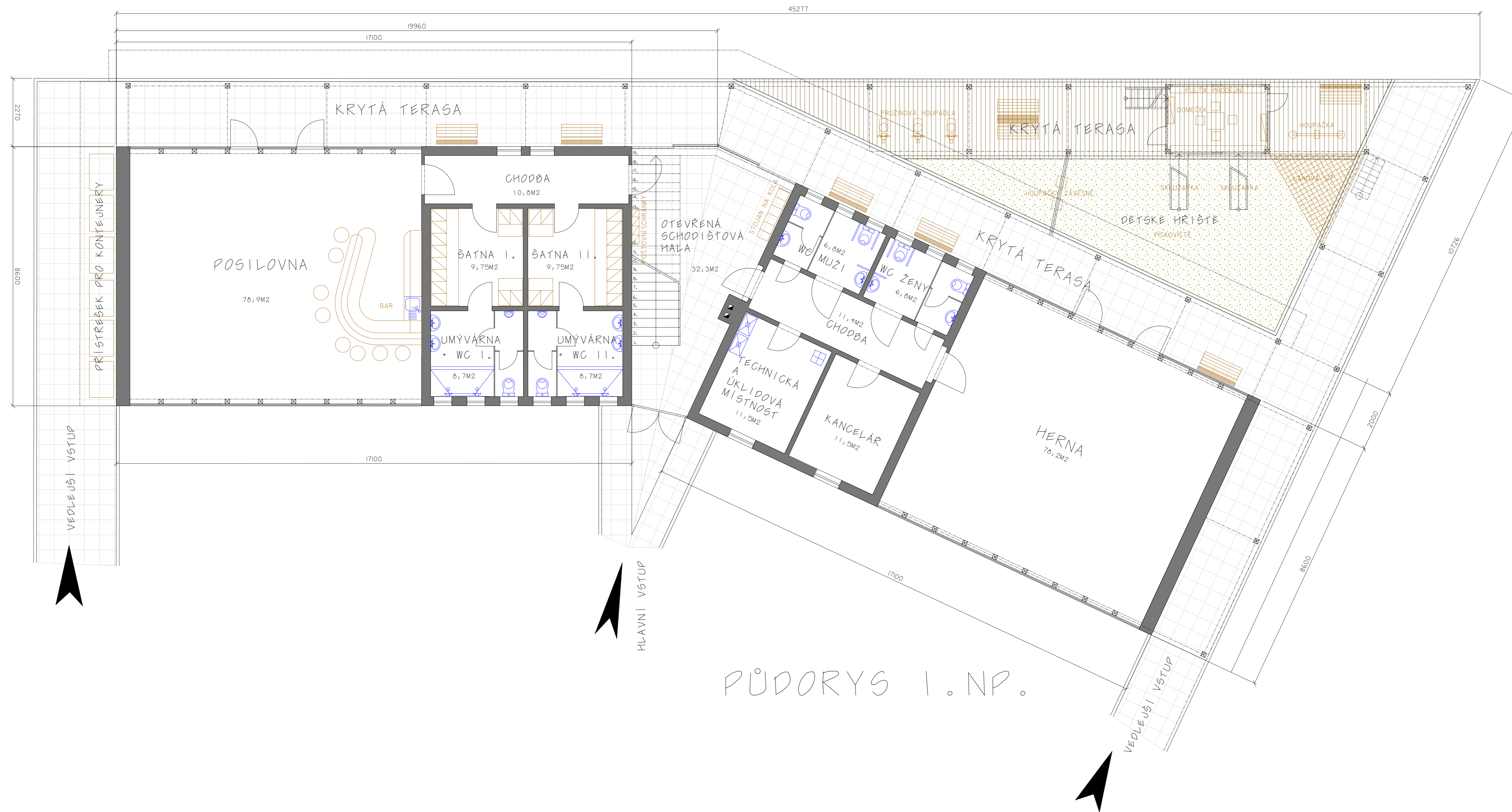
PŮDORYS 1. NP.